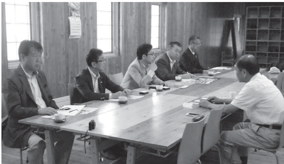
CLTを使った研修施設（北見市留辺藪町）

CLTの活用について5月30日～31日に津別町、北見市に視察に行ってきました。今議会の予算特別委員会でも取り上げました。